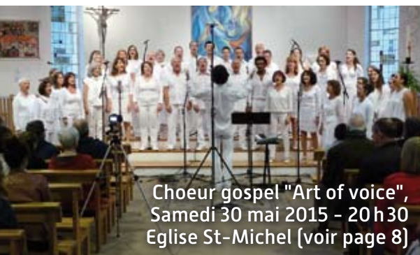
Choeur gospel "Art of voice", Samedi 30 mai 2015 - 20h30 Eglise St-Michel (voir page 8)