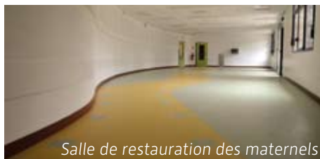
Salle de restauration des maternels

Le secteur restauration est entièrement équipé de matériel réglementaire, répondant aux normes européennes et HACCP.