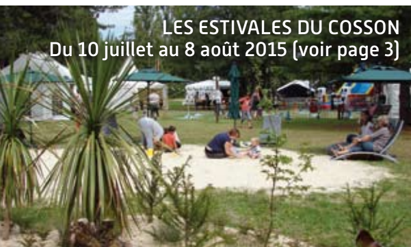
LES ESTIVALES DU COSSON Du 10 juillet au 8 août 2015 (voir page 3)