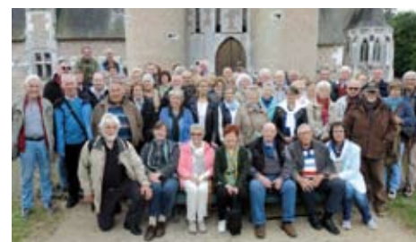
Accueil des Allemands de Rhede à La Ferté St-Aubin durant l'Ascension - Visite du château du Moulin

Rappel : dimanche 5 juillet : randonnée « Gare à Gare », inscrivez-vous vite auprès de l'Office !