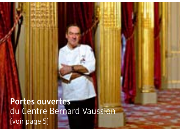
Portes ouvertes du Centre Bernard Vaussion (voir page 5)