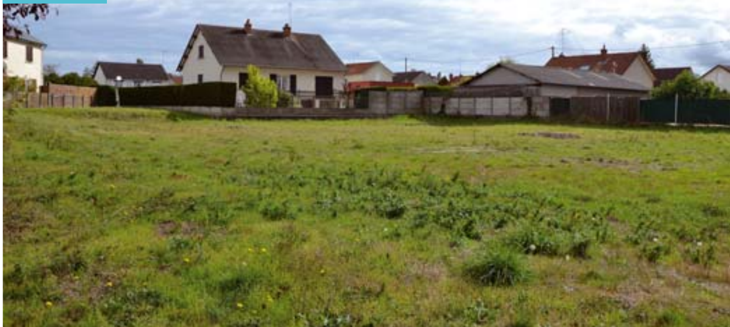
Terrain destiné à la construction de la Maison de Santé