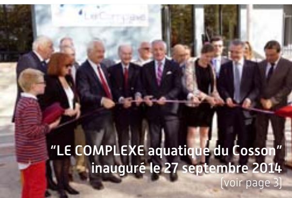
"LE COMPLEXE aquatique du Cosson" inauguré le 27 septembre 2014 [voir page 3]