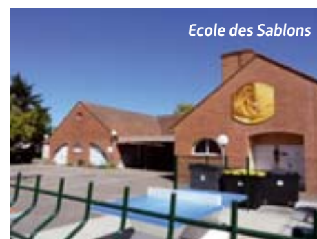
Ecole des Sablons

Deux portes acoustiques, des stores électriques et une VMC (ventilation mécanique contrôlée) ont été posés afin de permettre aux petits de profiter de leur temps de repos dans d'excellentes conditions. Une autre VMC a également été installée dans l'ancien dortoir dorénavant devenu bibliothèque. Par ailleurs, la salle de travail des Atsem a été entièrement