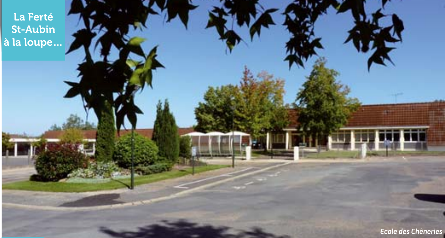
Ecole des Chêneries