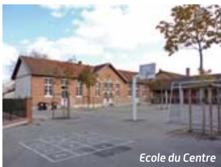
Ecole du Centre

À l'école du Centre, les moquettes du bureau