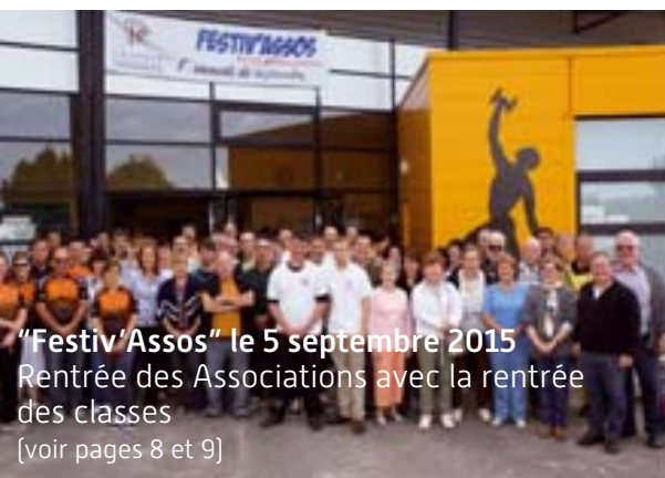
"Festiv'Assos" le 5 septembre 2015 Rentrée des Associations avec la rentrée des classes (voir pages 8 et 9)